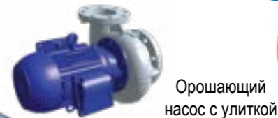
Орошающий насос с улиткой