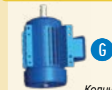
Количество может изменяться в зависимости от типа установки.