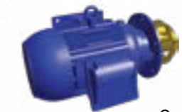
Орошающий насос без улитки