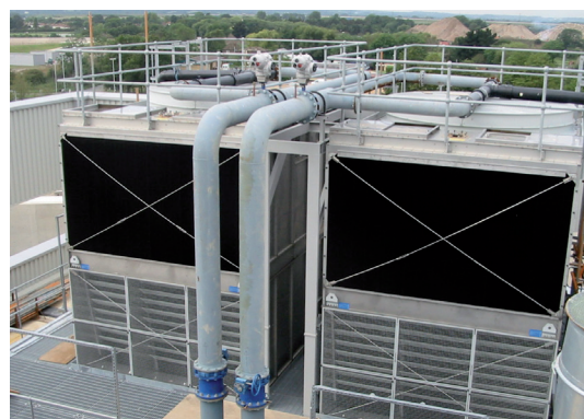
Umgerüstete Lufteintritts- Schutzelemente in der oberen Hälfte von BAC S3000 Kühltürmen mit traditionellen Jalousien darunter