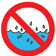
Herausspritzen von Wasser