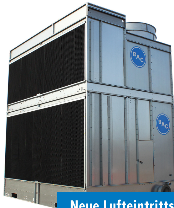
Neue Lufteintritts- Schutzelemente