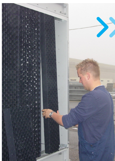
Einfach zu handhabende Lufteintritts-Schutzelemente